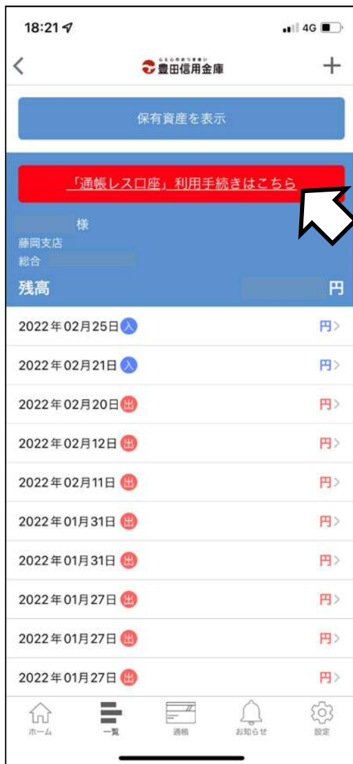
《残高明細画面イメージ》