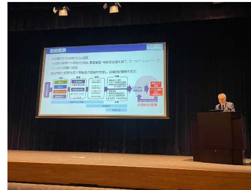
<豊田市副市長による取組紹介の様子>