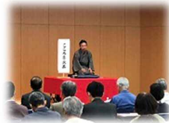
2019.11.19 (火) 当金庫本店7階大会議室にて 【参加者45名】