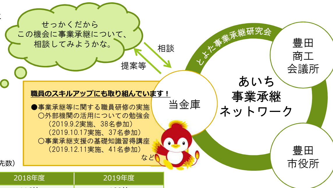
外部機関との連携イメージ