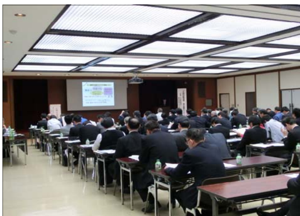
(会場の様子：西尾信用金庫本店会議室)

4金庫連携アジア会は、昨年10月より、愛知県に本店を置く、豊橋信用金庫、豊川信用金庫、西尾信用金庫と豊田信用金庫が連携し各金庫お取引先の海外展開を支援し、地域経済の発展に貢献することを目的に活動を行っています。本年8月より、経済産業省中部経済産業局が加わりました。同会では、中小企業の海外展開支援を行う各組織・団体や各国の政府省庁、銀行、不動産会社、コンサルタント等と協力関係を結び、企業様の海外展開をサポートさせていただいています。中小企業が海外展開する件数は今後増加するといわれています。同会では、各方面との連携を維持、拡大していくとともに企業様からのご相談には4金庫が連携して支援してまいります。今後、桑名信用金庫、東濃信用金庫の2金庫が加わり、6信用金庫の連携にて愛知・岐阜・三重へ活動の領域を拡げて参ります。